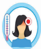
РЕЗКИЙ ПОДЪЕМ ТЕМПЕРАТУРЫ ТЕЛА И ОЗНОБ