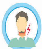
БОЛЬ, ПЕРШЕНИЕ В ГОРЛЕ