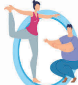
ВЕДИТЕ ЗДОРОВЬИЙ ОБРАЗ ЖИЗНИ