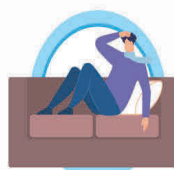
СОБЛЮДАЙТЕ ПОСТЕЛЬНЫЙ РЕЖИМ