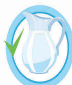
ПЕЙТЕ БОЛЬШЕ ЖИДКОСТИ