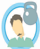
ОБЩЕЕ НЕДОМОГАНИЕ, СЛАБОСТЬ