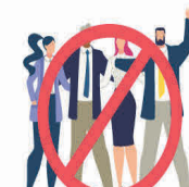
ОГРАНИЧЬТЕ ПРЕБЫВАНИЕ В МЕСТАХ СКОПЛЕНИЯ ЛЮДЕЙ