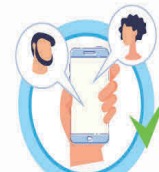
ИЗБЕГАЙТЕ КОНТАКТОВ С ЗАБОЛЕВШИМИ