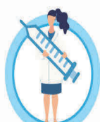
СДЕЛАЙТЕ ПРИВИВКУ ОТ ГРИППА