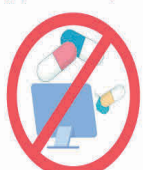
НЕ ЗАНИМАЙТЕСЬ САМОЛЕЧЕНИЕМ