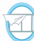
РЕГУЛЯРНО ПРОВЕТРИВАЙТЕ ПОМЕЩЕНИЕ