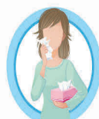
ИСПОЛЬЗУЙТЕ ОДНОРАЗОВЫЕ САПФЕТКИ ПРИ КАШЛЕ И ЧИХАНИИ