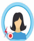
ЛОМОТА В МЫШЦАХ И СУСТАВАХ